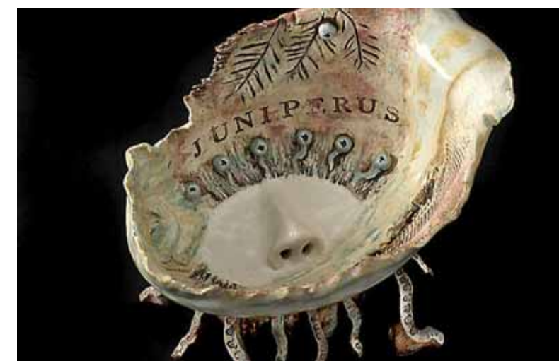
Bessen van de Juniperus worden verwerkt in jenever. FOTO'S FRANK VAN BIEMEN

leiden door geuren om ons heen. Dat kunnen geuren zijn waardoor we ons op een bepaalde manier gaan gedragen of een speciaal gevoel geven”, vertelt De Vos. „Tijdens de workshop onderzoeken we of er een parfum bestaat dat je geliefde dat vleugje extra geeft? Een echte beleef-workshop, die het goed doet als vrijgezellenfeestje.”