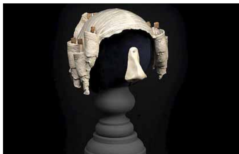
p-Ruik laat zich zien, voelen en ruiken.