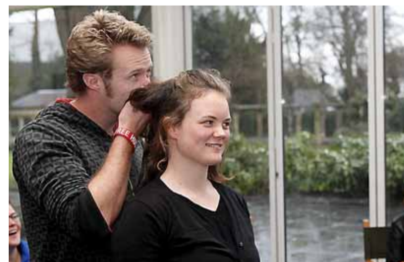
Deelnemers aan workshop Liefdesparfum in Singer Laren.